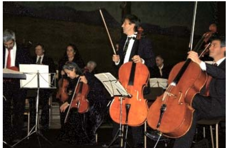
Il gruppo degli strumenti ad arco