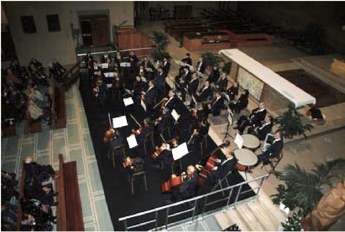
Il palco dell'orchestra posto davanti all'altare