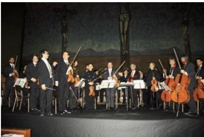
L'Orchestra sinfonica "Città di Magenta"