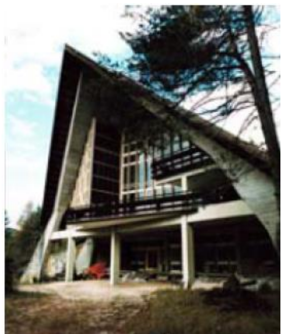
Centro riunioni della colonia estiva