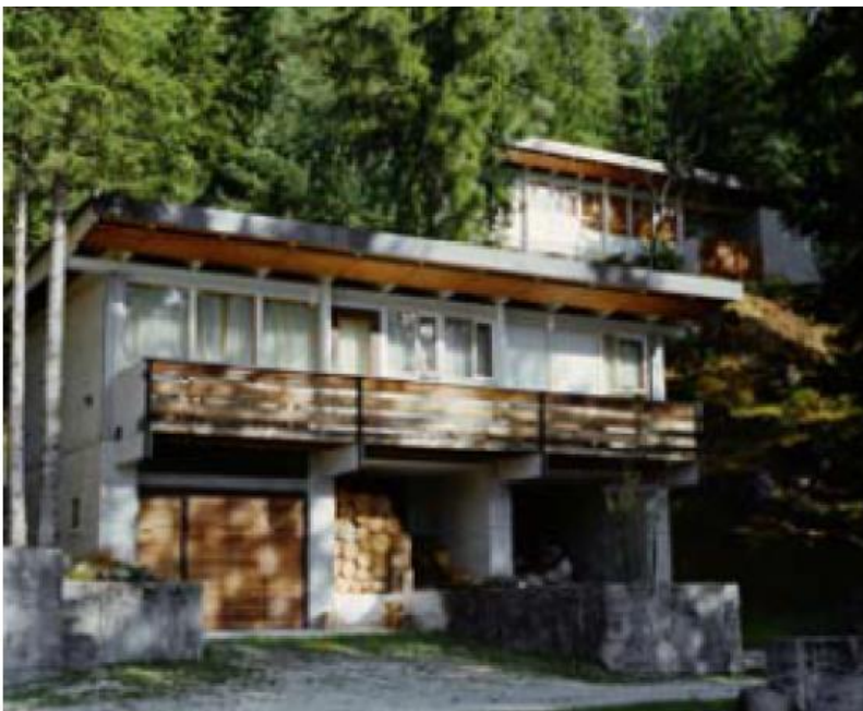
Villetta con balcone e garage sottostante