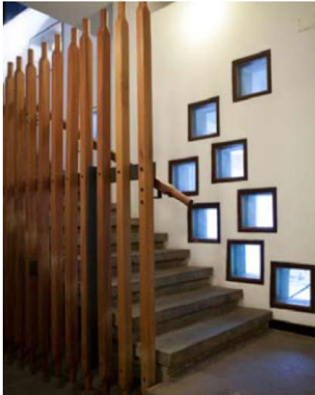
Scala nella colonia dei bambini