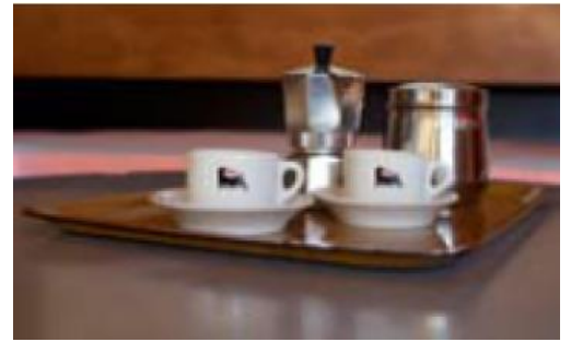
Servizio da caffè Eni