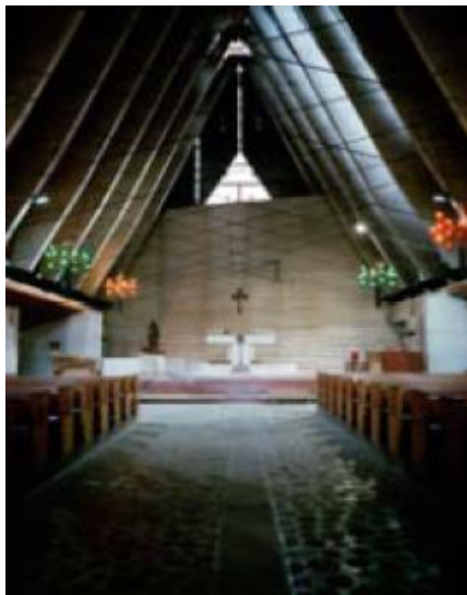
La chiesa del Villaggio