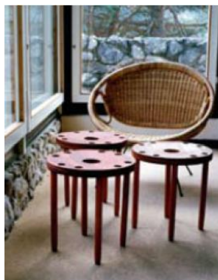
Sgabelli impilabili e una sedia