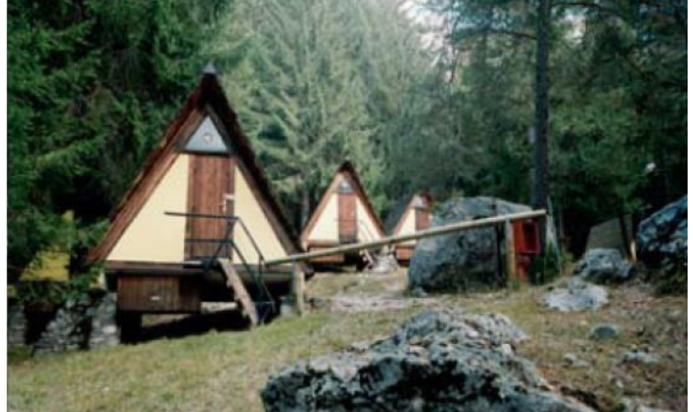
Le casette triangolari della colonia estiva per bambini