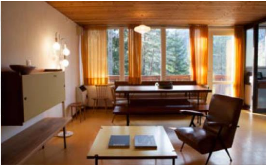
Soggiorno in una delle villette