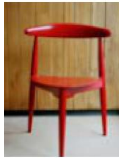
Sedia Hans Wegner FH 4103