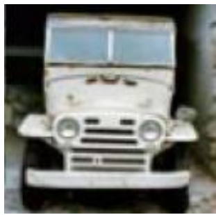
FIAT Campagnola in un garage