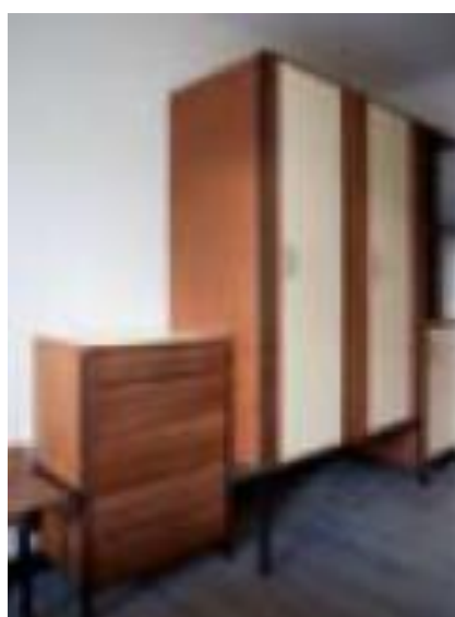
Mobili in mogano su misura