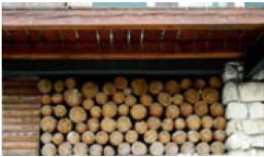
Deposito legna da ardere