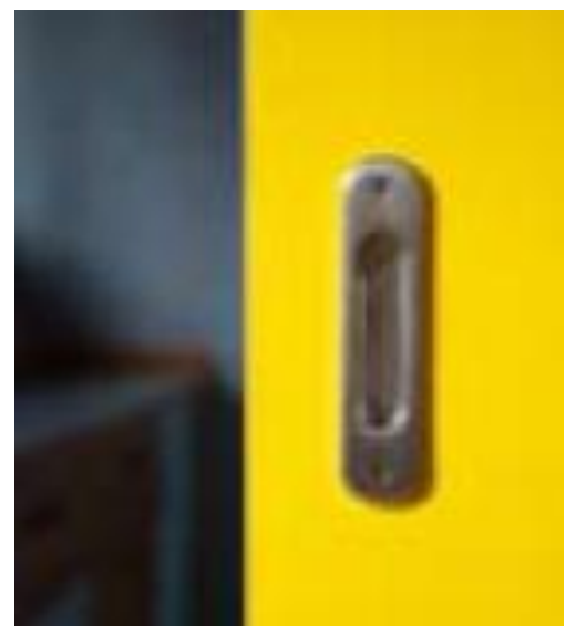
Porta cucina scorrevole