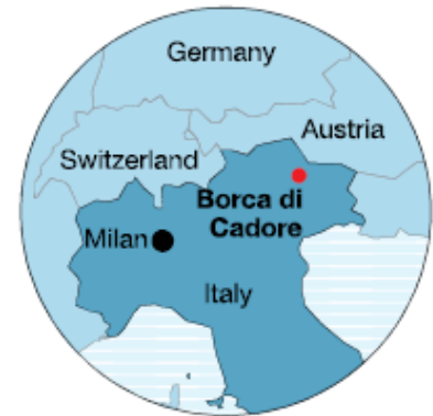
Dove si trova Borca di Cadore