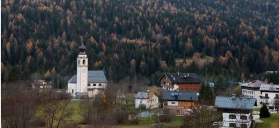
Borca vista dal villaggio di Corte di Cadore

La prestigiosa rivista inglese MONOCLE ha pubblicato un ampio articolo a doppia pagina sul Villaggio ENI nel numero di Dicembre-Gennaio 2013-2014. L'articolo, corredato di numerose fotografie, riassume la storia del Villaggio dalla sua costruzione fino ai giorni nostri, soffermandosi sugli aspetti architettonici più significativi. E' possibile scaricare una copia dell'articolo in formato PDF al link MONOCLE - Villaggio Eni.pdf