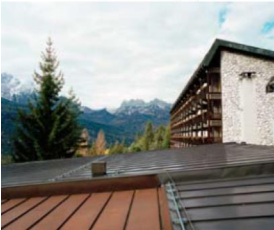
Vista laterale dell'albergo Boite