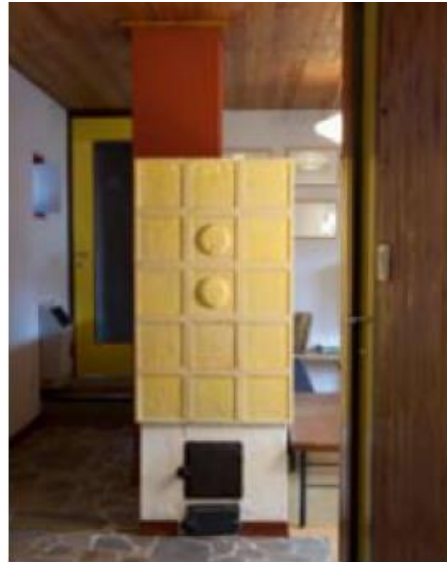
Stufe a legna in ceramica