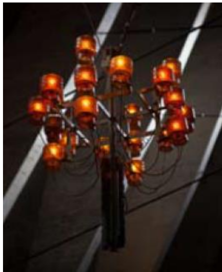
Lampadario in ferro battuto della chiesa