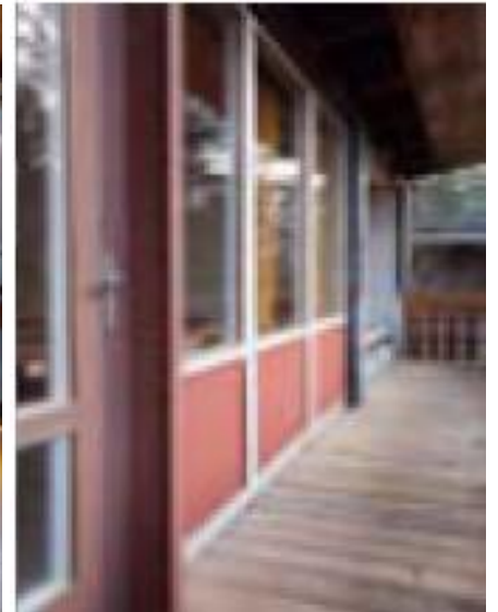
Il balcone di una villetta