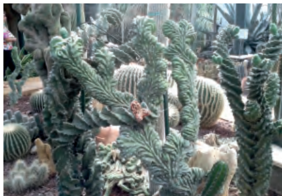
Un particolare del giardino botanico