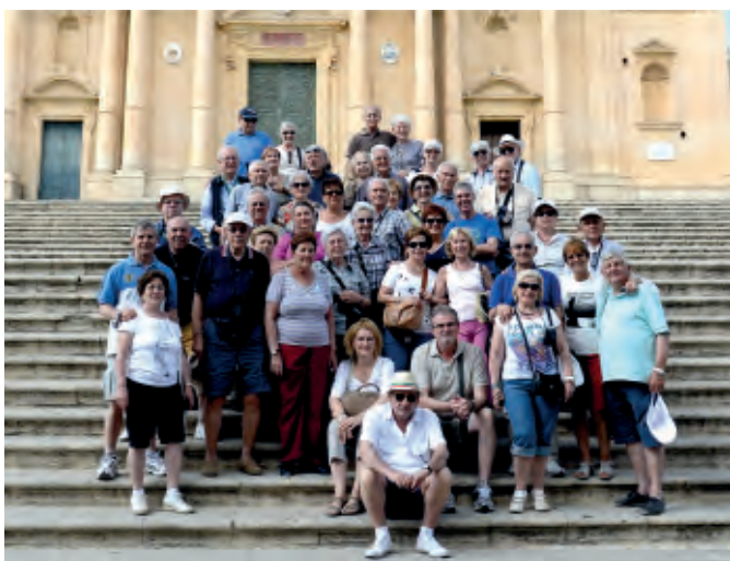
I partecipanti alla gita in Sicilia