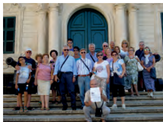
I partecipanti alla gita

I tre giorni di permanenza hanno permesso ai partecipanti di godere delle bellezze naturali dell'isola oltre a poter dedicare del tempo per lo shopping, inoltre a solo scopo di curiosità, non si è tralasciato di fare un salto al casinò DRAGONARA.