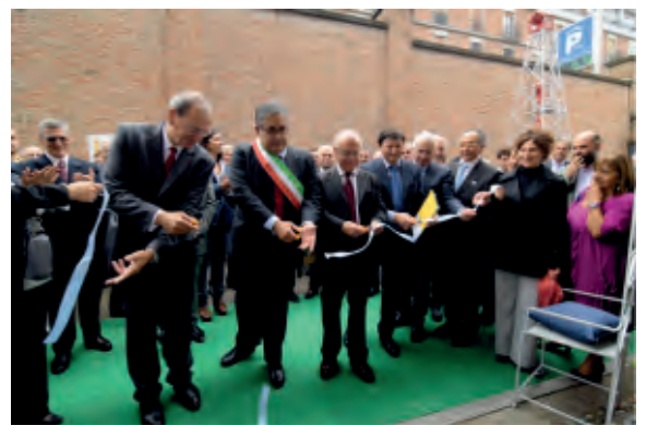
Inaugurazione del museo