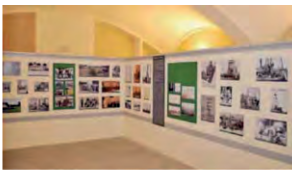
Esposizione interna Museo

Questo ha permesso il concretizzarsi di un prodigio burocratico e in meno di un mese si è arrivati alla firma della convenzione fra Comune e Associazione Pionieri e Veterani eni e ottenuto il fondamentale sostegno dell'ingegner Claudio Cicognani presidente della Drillmec, della Banca CentroPadana, del Edison Gas Plus ed di altri sponsor per i costi dell'allestimento grazie ai quali si è potuto iniziare a lavorare per inaugurare il Museo nei tempi stabiliti.