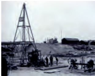
1920 Pozzo nel Piacentino