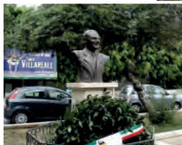
Alcuni momenti della commemorazione.