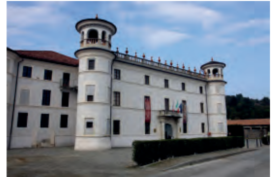
Il castello di Roccolo

Il 18 ottobre abbiamo fatto una bellissima gita a Caraglio e visitato il filatoio, un grande edificio costruito nella seconda metà del '600 da Giovanni Galleani con lo scopo di raccogliere in un'unica struttura protetta tutti i processi legati alla produzione della seta. È stato recentemente restaurato con i fondi dell'Europa. Molto interessante anche il Castello di Roccolo: un edificio neogotico costruito agli inizi dell'800 da Roberto Tapparelli d'Azeglio, fratello di Massimo; circondato da un bel parco ricco di rigogliosi castagni e altra vegetazione.