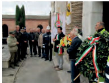
Alcuni momenti della commemorazione

Mattei che ha creato un impero energetico per la nostra Nazione. Vi hanno preso parte rappresentanti dell'Amministrazione Comunale di Matelica, vari tecnici, ingegneri e architetti che hanno illustrato ciò che oggi si dispone per la produzione ecologica di energia e il suo utilizzo con risparmio di costi. Novità assoluta è stata la presentazione di una pala microelica di