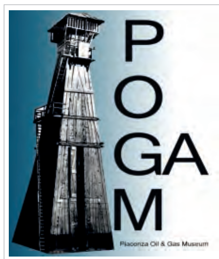
Il logo del Museo

In questi 30 giorni hanno visitato il Museo circa 350 persone che oltre a elogiare l'iniziativa hanno promesso che sarebbero ritornati. Nel Museo Civico di Storia Naturale è stata inserita una parte del