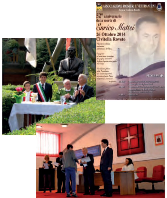
Dall'alto: locandina realizzata in occasione della commemorazione di Enrico Mattei; un momento della commemorazione; consegna delle borse di Studio "Enrico Mattei"