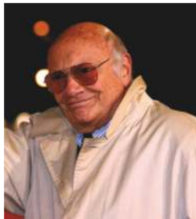
Il regista Francesco Rosi