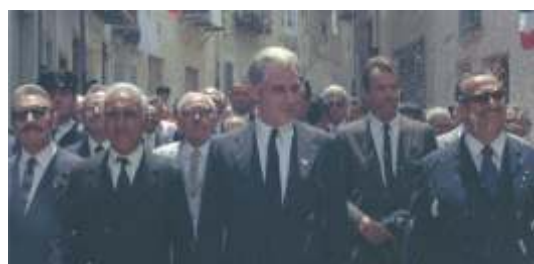
Una scena tratta dal film "Il caso Mattei"

Quando nel 2005 realizzò "Le mani sulla città", film denuncia sui meccanismi della speculazione edilizia e relative lobby si guadagnò addirittura una laurea ad honorem; nel 2008 gli viene assegnato a Venezia il Leone d'Oro alla carriera e nel 2009 la Legion d'Onore. Ancora un prestigioso riconoscimento con l'Orso d'Argento di Berlino.