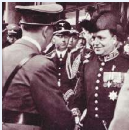
Mastromattei nel 1938 accoglie al Brennero, come Prefetto di Bolzano e rappresentante di Mussolini, Hitler ed Himmler in visita ufficiale in Italia

In questo racconto ci sono sicuramente imprecisioni e lacune, che mi auguro saranno segnalate all'Apve per tentare di ricostruire la verità storica.