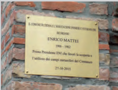
La targa in ricordo di Mattei