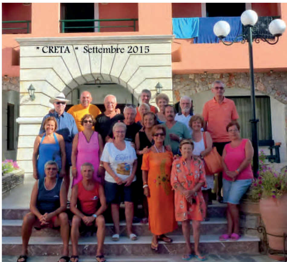
Alcuni associati del gruppo APVE di Torino durante l'annuale soggiorno marino di settembre 2015 che si è tenuto all'EDEN Village di Kournas sull'isola di Creta.

Un'isola da vedere per le sue caratteristiche climatiche, paesaggistiche, ma soprattutto per la parte storico culturale.