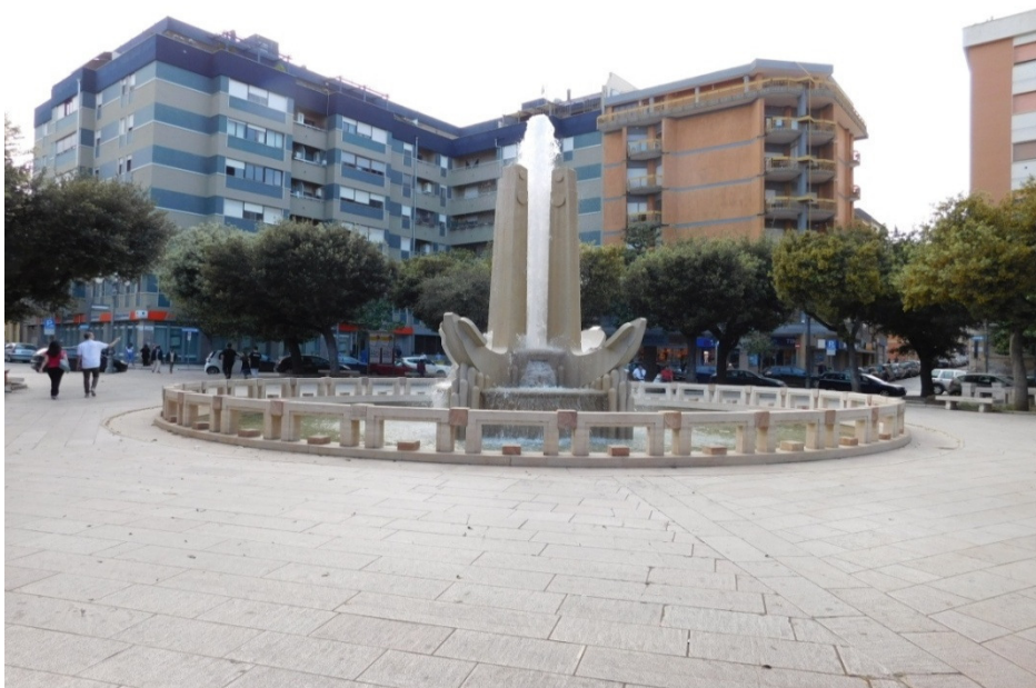
Brindisi: La fontana