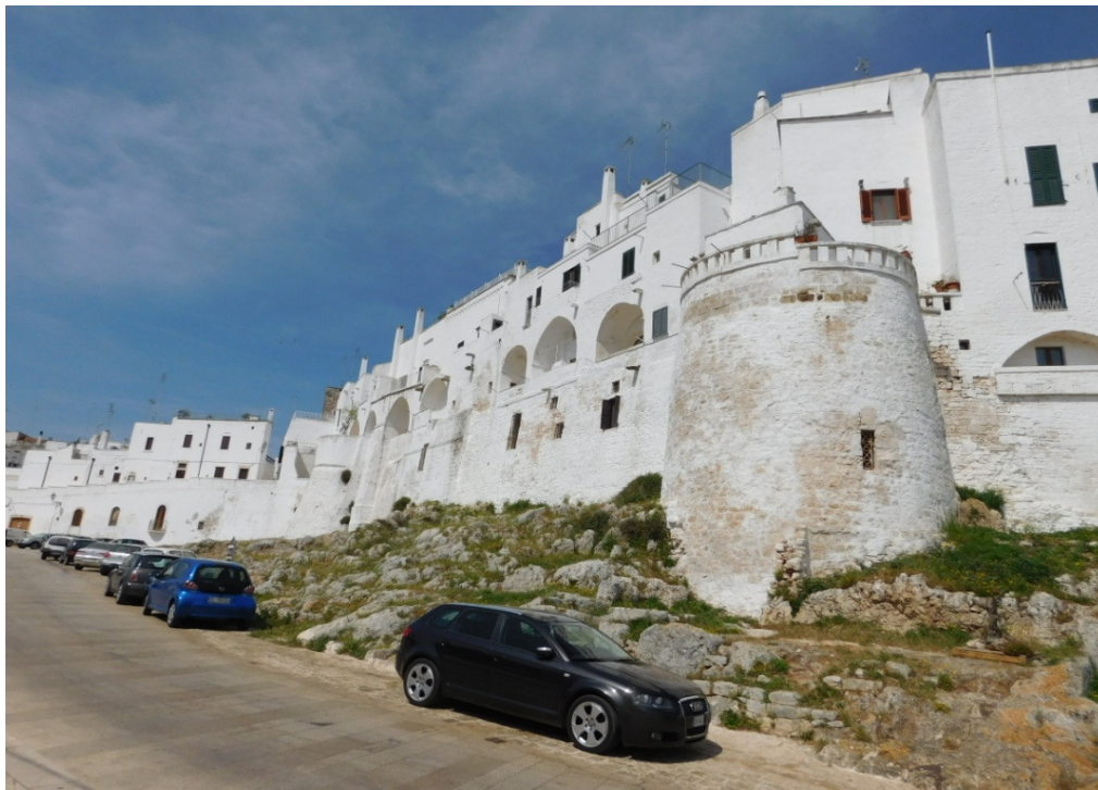
Ostuni: La città bianca

Notiziario Gita in Puglia - Apr. Mag. 2018