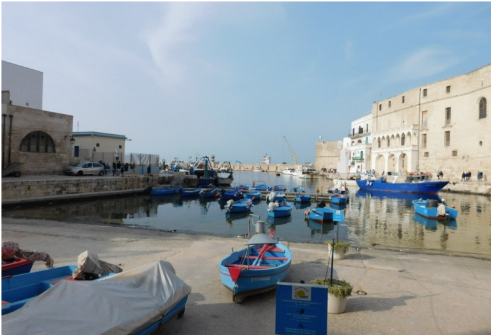
Monopoli: Il porto