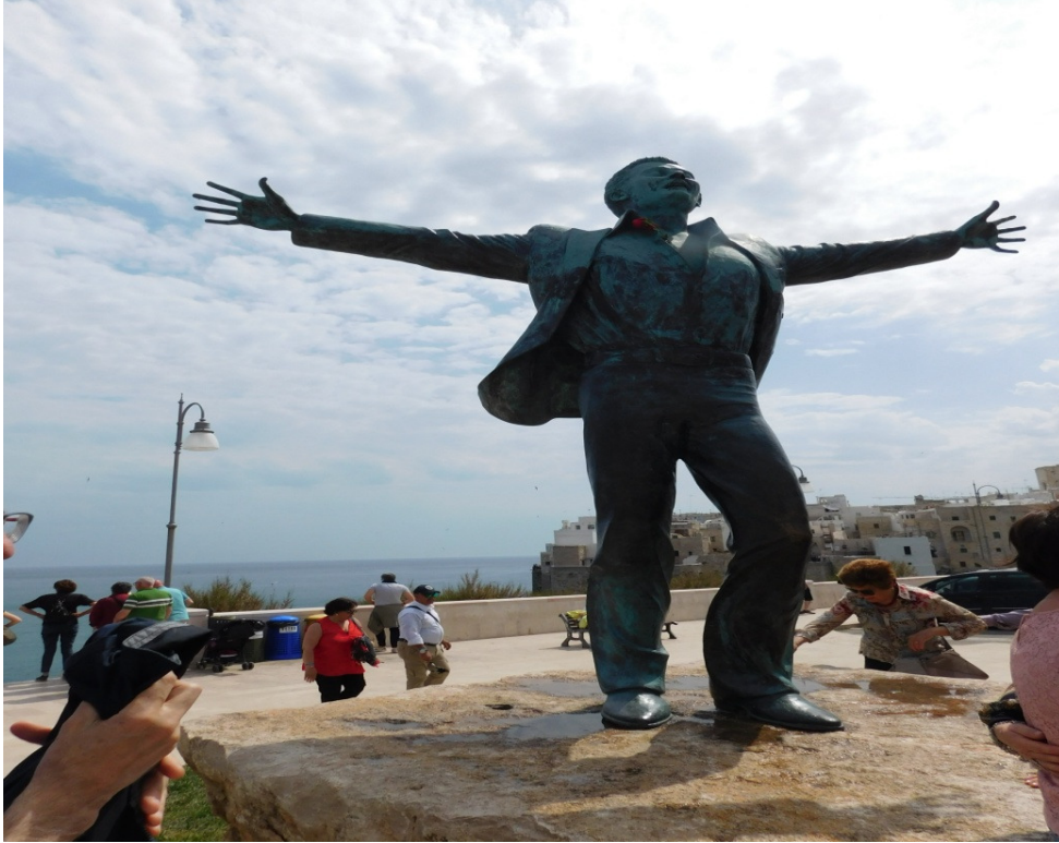
Polignano a mare: La statua di Domenico Modugno

Notiziario Gita in Puglia - Apr. Mag. 2018