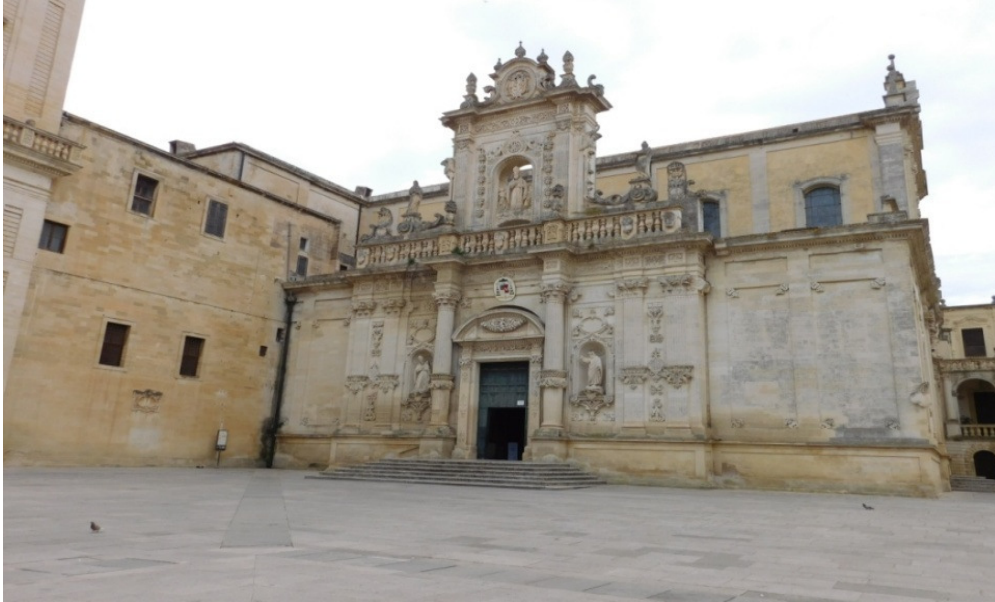
Lecce: Il Duomo

Notiziario Gita in Puglia - Apr. Mag. 2018