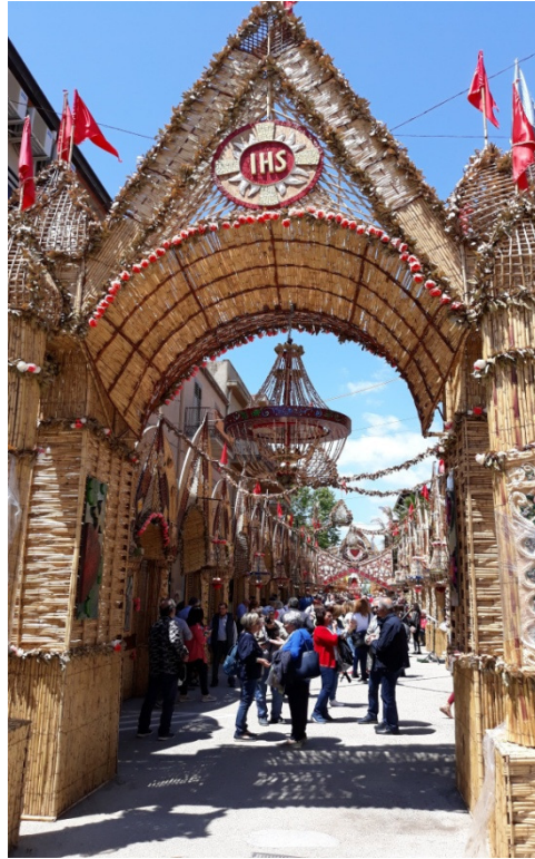
Gli “Archi di Pasqua” o “archi di Pane”

Notiziario - Gita a San Biagio Platani 02/06/219